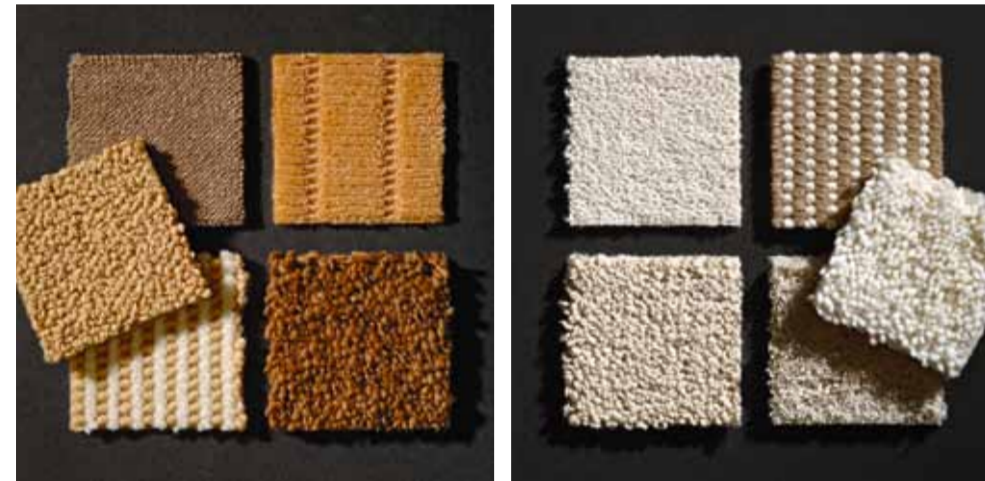
Les univers de couleurs de la collection « Ulf Moritz by Vorwerk » : A, B, C, D, E et F / コレクションの中のカラーウェイ “フォアベルクによるウルフ・モリッツ” A、B、C、D、EそしてF