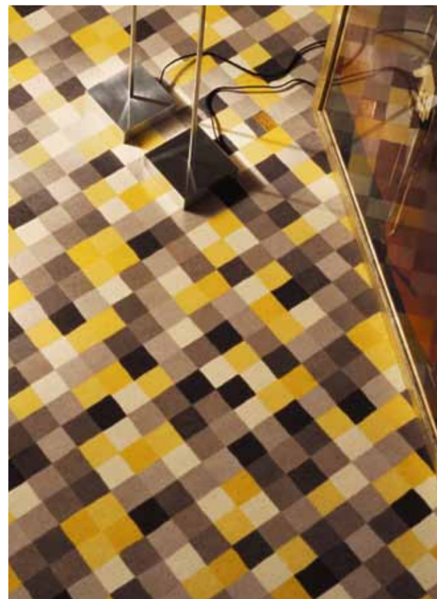
Gertrud Arndt, croquis de motif (à gauche) et sa réalisation, extrait de la collection dialog art collection de Vorwerk (à droite) / ゲルトラッドアルト、参考絵画 (左側) とフォアベルク (右側) のダイアログアート・コレクションからの繰り返しパターンの参考作品