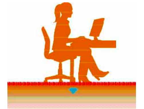
Avec les moquettes et les tapis, la perte de chaleur est limitée. / カーペットを敷いた床の熱の低放出度

ん。フォアベルクカーペットは長年その品質を変えることはありませんでした。そのユニークな染色方法、製造工程での残余物の再利用や、革新的なTEXtiles®技術のようなコーティング手法：ごみやホコリ、また抜け毛を出さないフォアベルクの高品質製造工程。それにより非常に優れた耐久性、品質の維持を