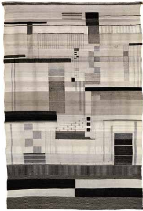
Gunta Stözl, Tenture en noir et blanc, 1923/24, VG Bild-Kunst Bonn / グンタ・シュテルツル、白黒の壁掛け、1923年-1924年、VGビルド-カント-ボン