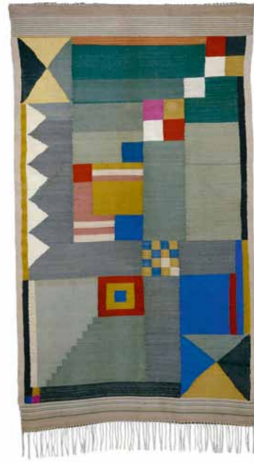
Benita Koch-Otte, tapis pour chambre d'enfant, 1923, Klassik Stiftung Weimar / ベニタ・コッホ-オテ、子供部屋のカーペット、1923年、ゲーテ国立博物館