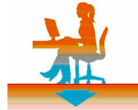
Avec les sols durs, la perte de chaleur est plus élevée. / ハードフロアの熱の高放出度

“もちろん将来の事は考えます。“マーケットウェインがある時に言っていました。”私の残りの人生をそれに掛けて行くのですから。”継続と維持は今に始まった概念ではありません