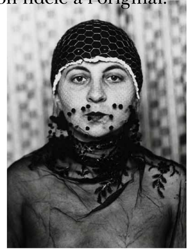
Gertrud Arndt, Maskenselbstportrait (Autoportrait masque), Dessau 1930, Bauhaus-Archiv, Berlin / (c) VG Bild-Kunst Bonn, 2010 / ゲルトラットアーント、Maskenselbstportrait、デッサウ、1930年バウハウスアーカイブベルリン / (c) Bild -芸術ボン、2010年 “

バウハウス・ワイマールは、1919年の女生徒が男生徒と同様に入学した州立の最初の近代芸術学校です。女生徒の割り当ては50%からスタートし、きわめて高い割合でした。女性も全てのワークショップに参加することは可能でしたが、実際は織物、陶芸や製本が主でした。特に織物は女性によって厳格にコントロールされており、すぐにエネルギーで独創性に溢れたプロフェッショナルが誕生する、きわめて質の高いワークショップとなります。 “私達は、現状の存在と新しいライフスタイル